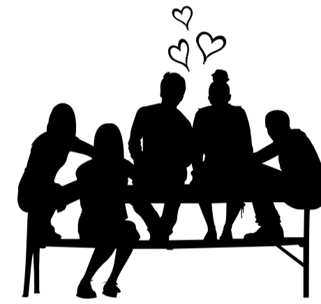
Moi, mes amis et mes amours