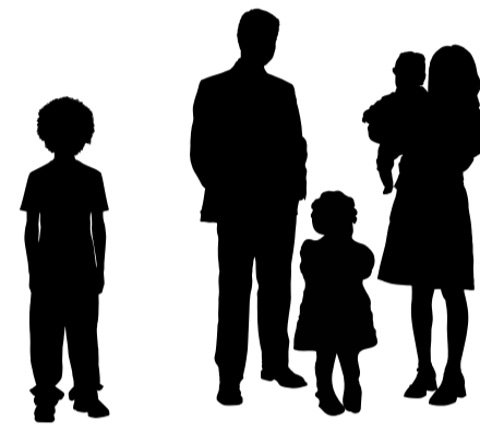
Moi et ma famille

Quel type de prise en charge est le mieux adapté à ma problématique ?